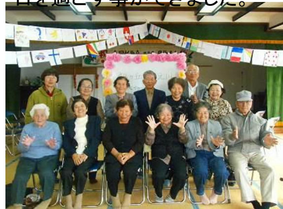
福祉センターでパチリ!

初めての合同開催との事で、まずは『名前覚えゲーム』で自己紹介をし、その後、島内名所見学へ出発しました。和気あいあいと交流を深め楽しい1日を過ごす事ができました。